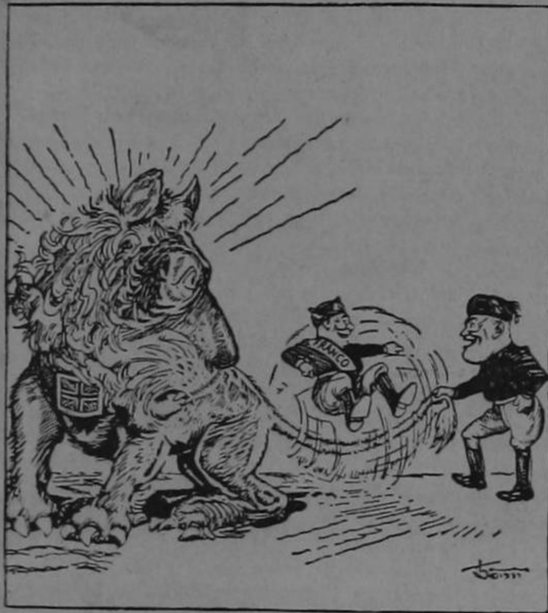
LOS MUCHACHOS SE DIVIERTEN.

recible. Y para colmo de males se empiegan las cosas con la guerra civil que se ha armado. Según vemos (Pasa a la página OCHO).