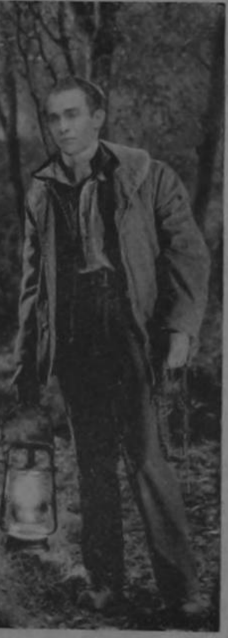
(Ayudando a buscar con linterna a sus adversarios).